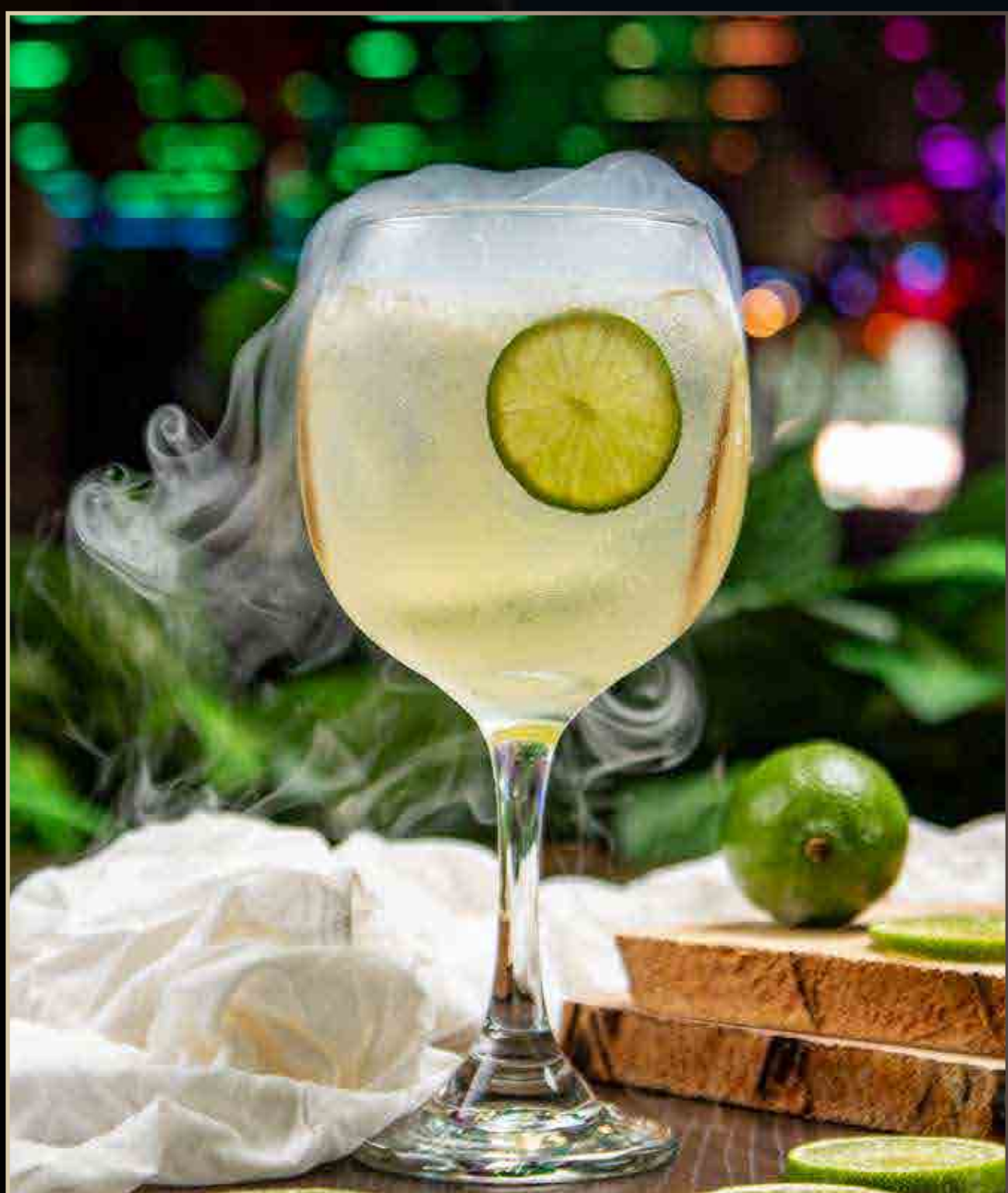
Gin Tonic El Santo.