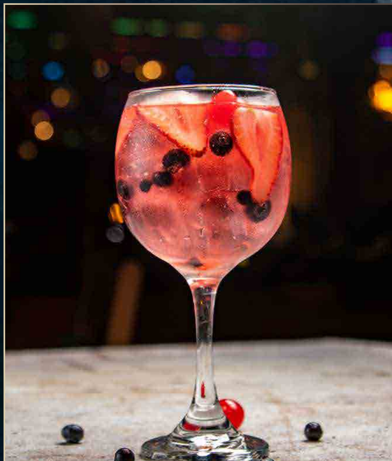
Gin Tonic Chapulín.